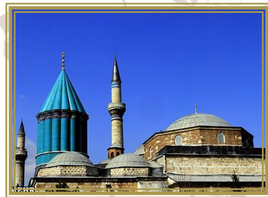
مقبره مولوی در قونیه