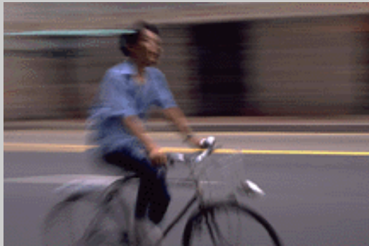
Caption describing picture or graphic.

You can use secondary headings to organize your text and to make it more scannable for the reader.